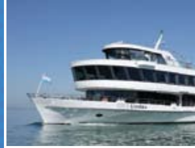
MS Lindau Bodensee Schiffsbetriebe

Das Netzwerk Bodensee feiert im September sein 5-jähriges Bestehen. Anlässlich dieses Jubiläums gibt es ein neues Event: Das 1. Herbstfest Bodensee.